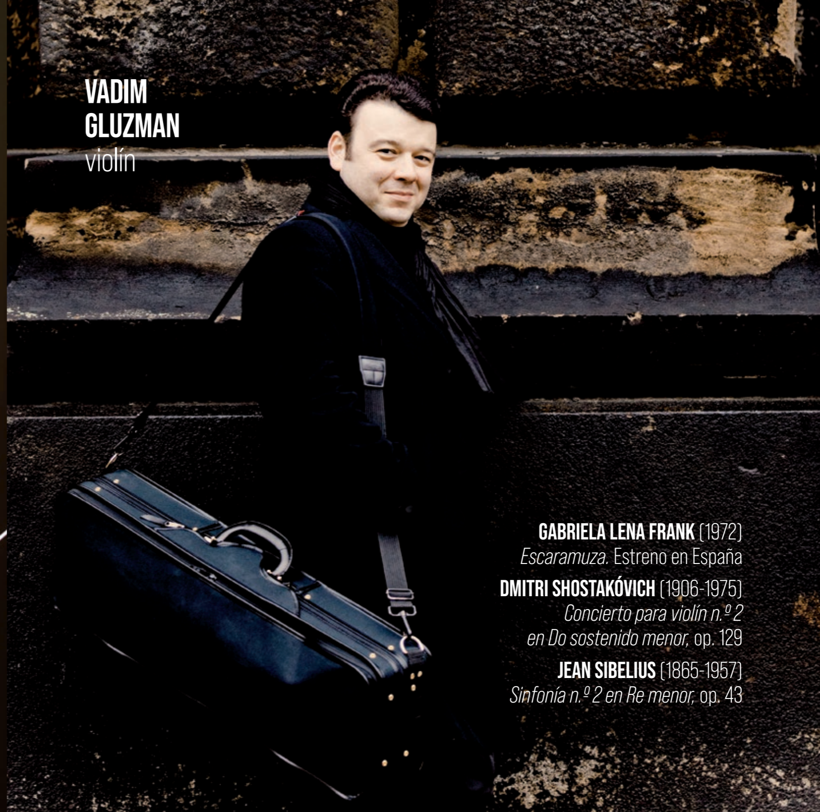
VADIM GLUZMAN violín