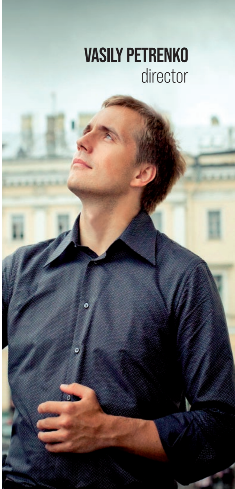
VASILY PETRENKO director

Salamanca | Ponferrada | La Bañeza | Benavente