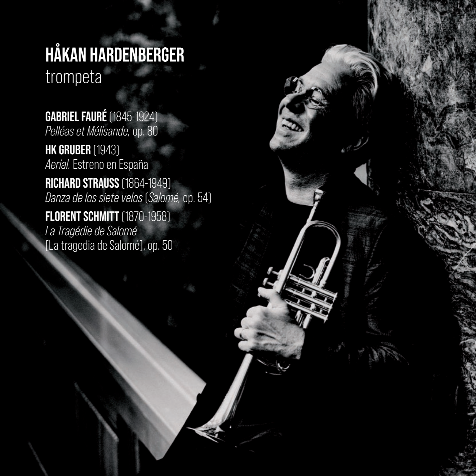
HÅKAN HARDENBERGER trompeta