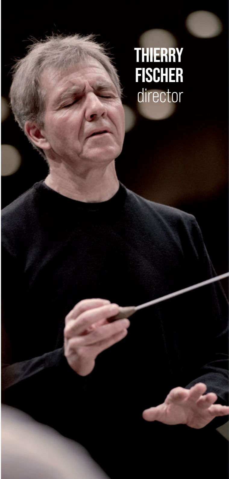
THIERRY FISCHER director

PROXIMIDAD Miranda de Ebro | Aguilar de Campoo