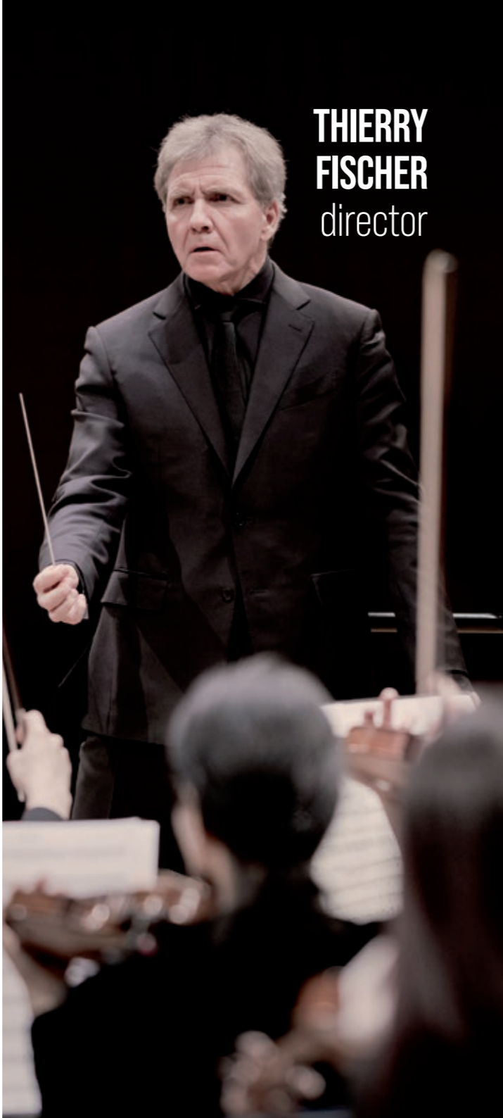
THIERRY FISCHER director

PROXIMIDAD León | Ponferrada | La Bañeza | Benavente