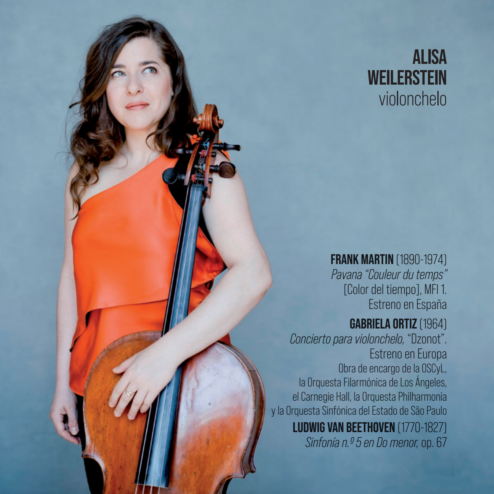
ALISA WEILERSTEIN violonchelo