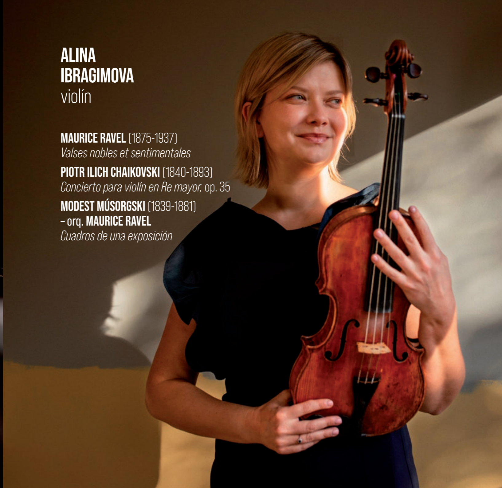
ALINA IBRAGIMOVA violín