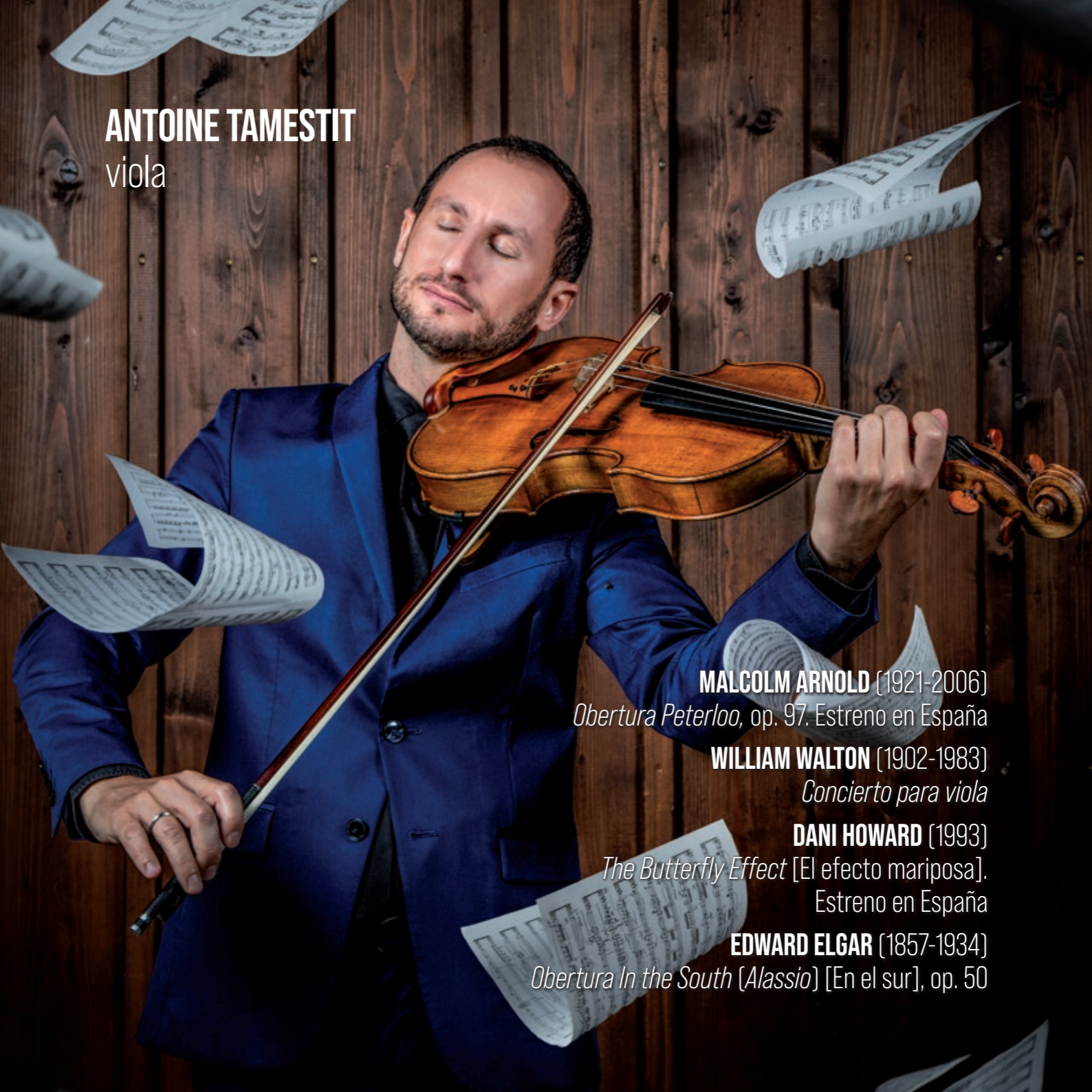
ANTOINE TAMESTIT viola