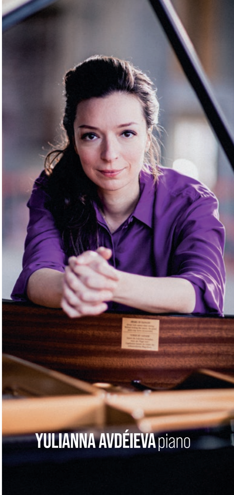
YULIANNA AVDÉIEVA piano